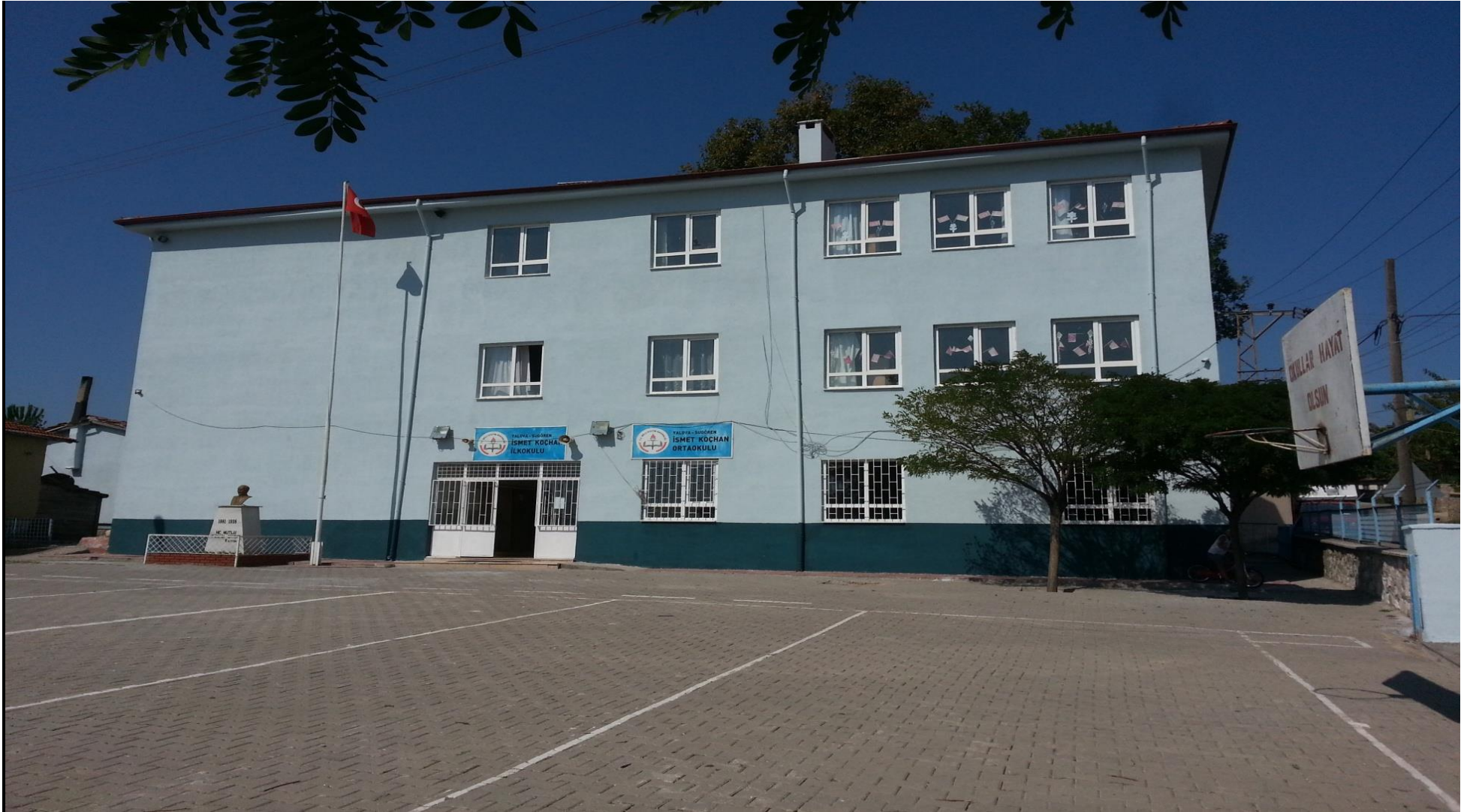
SUGÖREN İSMET KOÇHAN İLK-ORTAOKULU MÜDÜRLÜĞÜ